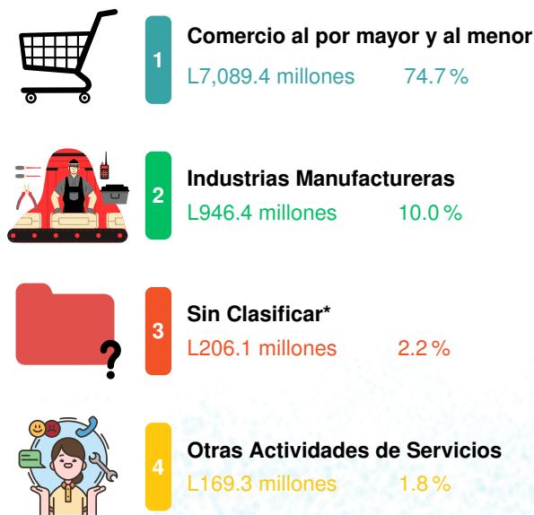
Figura 1: Principales actividades económicas con mayor aporte a la recaudación aduanera Hasta Febrero de 2025 Valores en millones de Lempiras