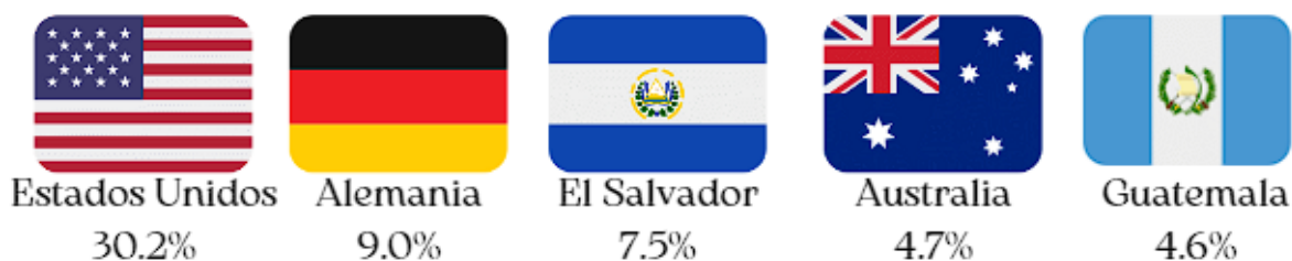
Ilustración 2. Exportaciones definitivas por país de destino Agosto de 2022