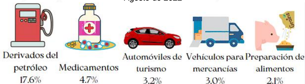
Ilustración 3. Principales importaciones definitivas Agosto de 2022