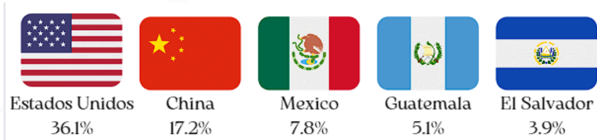
Ilustración 3. Importaciones definitivas por país de origen Agosto de 2022