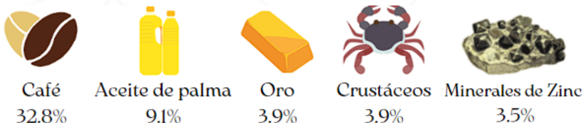
Ilustración 1. Exportaciones definitivas Agosto de 2022