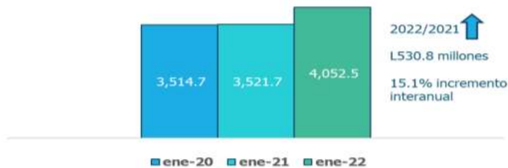
Gráfico 1. Recaudación tributaria aduanera Enero de 2020-2022 En millones Lempiras

Fuente: Sección de Análisis y Estadísticas Aduaneras con datos del Sistema Aduanero de Rentas Aduaneras de Honduras.