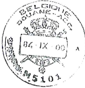
= French language version/ Version en langue française

The number of the issuing office (at the bottom) will vary (see tables on pages 017M002, 017M003, 017M004 and 017M005)