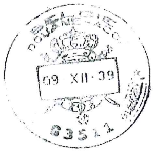
= Dutch language version/ Version en langue néerlandaise